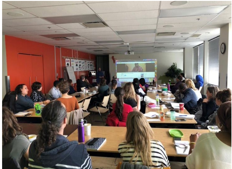
Formation sur les deuils migratoires et l'intervention

Durant l'année, un soutien individuel à été accordé à de nombreux organismes : des lettres d'appui pour des demandes de subvention, des conseils sur des projets, un soutien avec des défis rencontrés et d'autres formes d'assistance formelle et moins formelle.