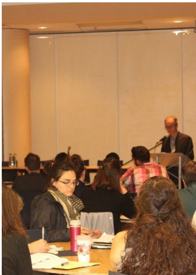
Forum Logement social et abordable : Inspirations d'ailleurs pour agir ici