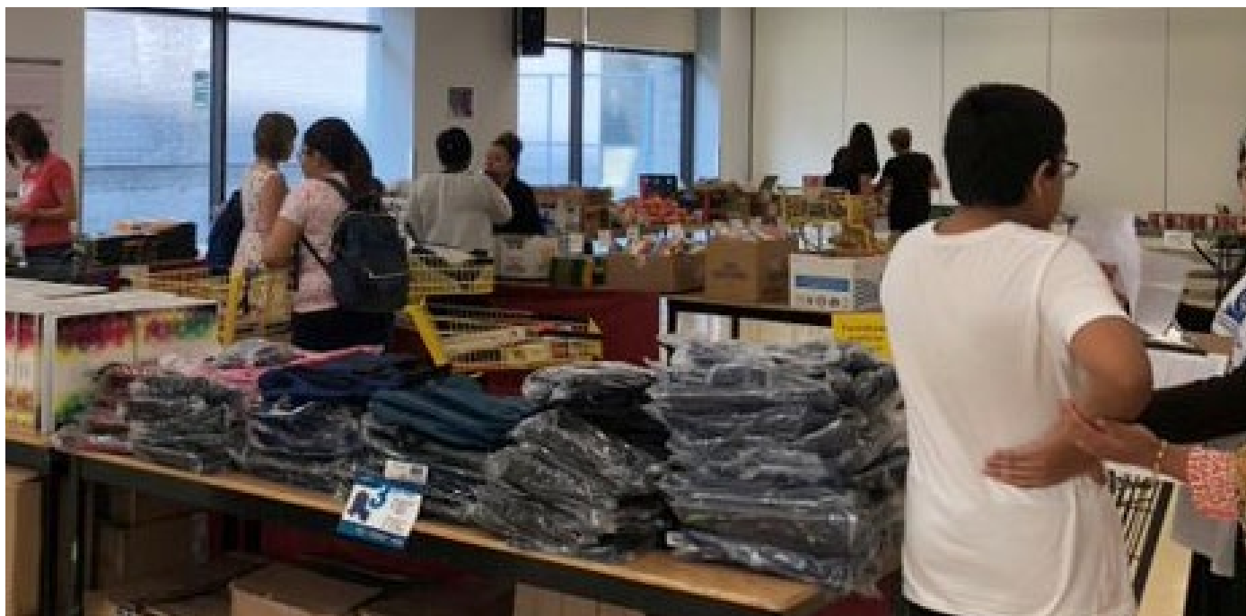
Dépannage réseautage de la rentrée