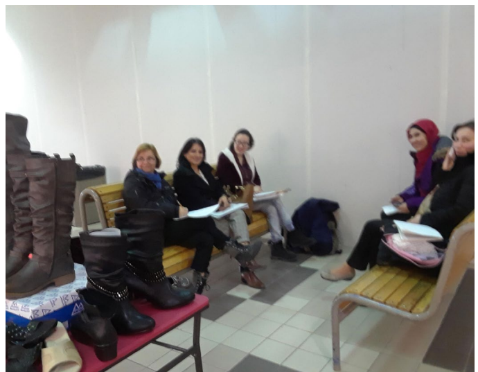
Alarme incendie, la TF se réunit où elle peut !

Nous avons servi 132 enfants (soit 86 familles) sur les 140 prévus. Le reste des fournitures a été écoulé par Baobab familial à la rentrée scolaire et au cours de l'année.