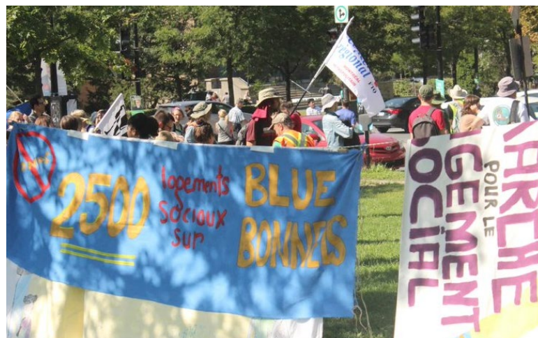
Grande marche pour le droit au logement du FRAPRU

La Table a également suivi le travail du Chantier logement social et abordable du plan de quartier et des membres ont participé à plusieurs de ses activités.