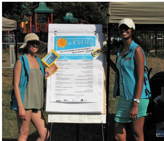
Équipe ICS d'été

En été, la programmation « ICS été » a pu se poursuivre pour une durée de neuf semaines, offrant aux familles un atelier et une sortie par semaine. C'était un excellent moyen de briser l'isolement de certains parents, leur offrir une occasion de faire de nouvelles connaissances et préserver le lien ICS-familles à travers des activités plus ludiques. Les ateliers ont eu lieu tous les mercredis, offrant aux parents un panel thématique varié et une halte-garderie pour les tout-petits. Quant aux sorties, elles visaient à faire découvrir aux familles la Ville de Montréal : visiter le musée des Beaux-Arts, contempler le merveilleux spectacle de feux d'artifice, s'initier à l'art du cirque dans le Quartier des spectacles, s'offrir une belle aventure nautique sur le Canal-Lachine, tel a été le rendez-vous hebdomadaire des ICS et les familles.