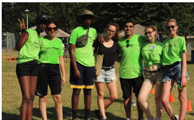
Équipe de Parcs animés

Le comité La Ruche collabore avec plusieurs autres projets similaires dans cinq quartiers de Montréal, dans le but de partager et développer une communauté de pratique, de développer des formations à partager entre quartiers, et de mieux comprendre la mobilisation des familles et de la communauté.