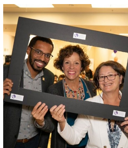
Cérémonie de bienvenue