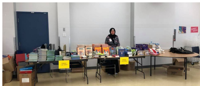
Dépannage réseautage de la rentrée

À noter que plusieurs membres de la TF sont présents sur les chantiers issus de la planification stratégique de quartier (PSQ). Ils se penchent notamment sur les problématiques concernant l'emploi, le logement, les barrières linguistiques et les besoins de base touchant directement les familles du quartier. Cependant, la TF prévoit le revisiter avec l'objectif d'asseoir une vision pour le quartier en lien avec la planification stratégique.