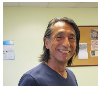
Les intervenant.es du Projet Escouade