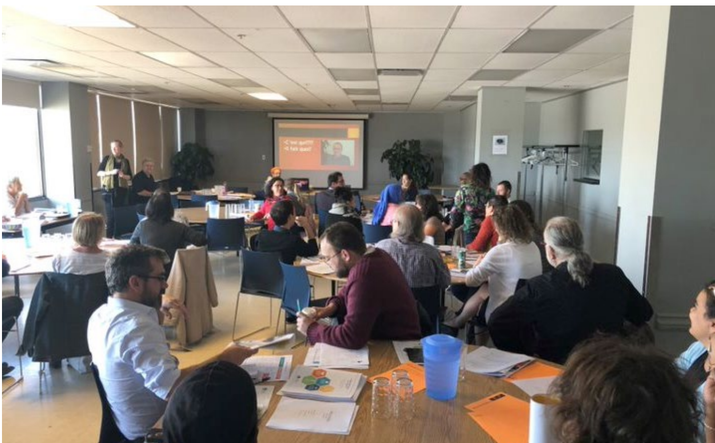
Assemblée générale annuelle 2018