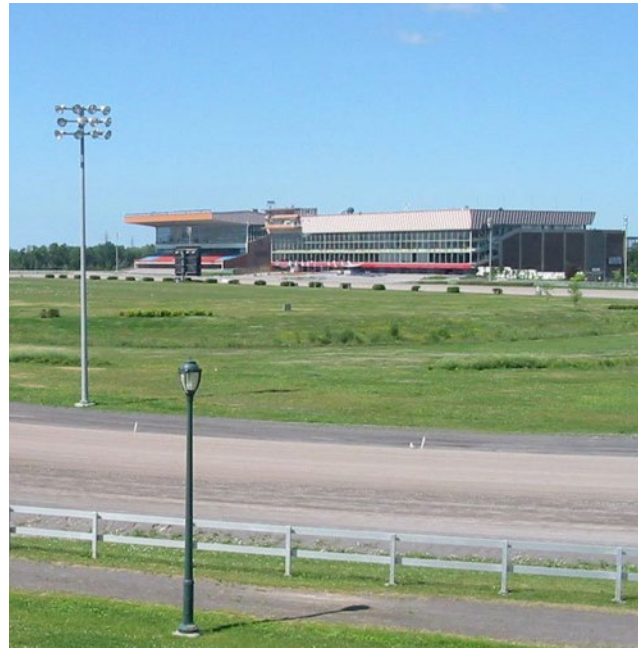
Blue Bonnets (ancien Hippodrome de Montréal)

Le comité a continué le suivi de l'aménagement du secteur « Le Triangle » et a mis de l'avant le besoin pour beaucoup plus de logements sociaux dans ce développement majeur. Le dossier du développement de Blue Bonnets (l'ancien Hippodrome de Montréal), porté par les organismes et résident.es du quartier depuis plus de 25 ans, est encore un dossier prioritaire et suscite beaucoup d'espoir dans le quartier. Le comité a rencontré des organismes impliqués dans l'aménagement du site Louvain dans Ahuntsic et s'est inspiré de leur exemple pour développer une proposition de planification conjointe milieu-Ville pour Blue Bonnets. Une rencontre a eu lieu avec le service d'urbanisme de la Ville-centre. Des préparations sont en cours pour une consultation publique qui s'en vient dans la prochaine année.