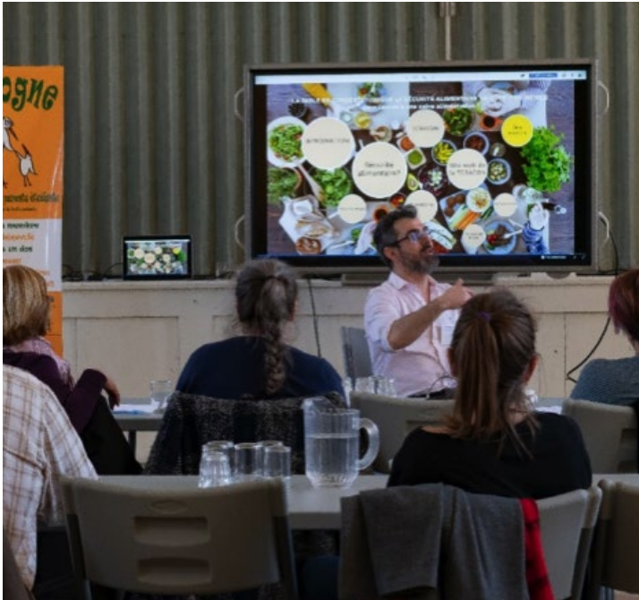
Café communautaire de la TCSA