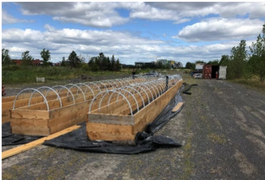
Projet de serre sur Blue Bonnets

Le Chantier n'est pas arrivé à obtenir un financement PIC pour le projet. Il a donc débuté avec une partie de ce projet, soit développer des activités de production à l'échelle locale. La proximité des acteurs locaux, siégeant au sein du comité de suivi du PSQ, a permis le développement d'un projet écoresponsable de culture maraîchère sur une superficie de 1,7 hectare (environ) sur le site de l'Hippodrome Blue Bonnets pour une durée temporaire. En effet, l'arrondissement Côte-des-Neiges - Notre-Dame-de-Grâce a soutenu un projet d'occupation transitoire du site par le biais de la réalisation d'un projet commun : projet d'agriculture urbaine et de sécurité alimentaire, mené par trois organismes (SOCENV, MultiCaf et Dépôt de NDG), sur un horizon limité à environ 6 ans (2019-2025). Le projet en est à sa première année et l'installation d'une serre est prévue pour la fin du mois d'octobre.